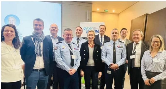
Colloque «cybersécurité des grands événements» organisé par l'UBS

Participation au colloque sur la cybersécurité des grands événements publics organisé par la fondation de l'université Bretagne Sud à la Direction générale de la Gendarmerie nationale à Issy-les-Moulineaux.