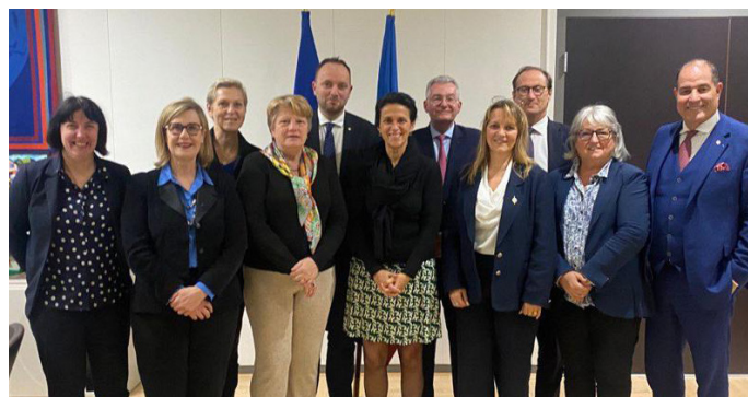
Réunion du groupe de travail sur l'Afrique

Je les ai notamment interrogés sur l'impact des orientations budgétaires passées sur l'innovation dans les domaines de l'Espace et de la Cyberdéfense en vue de la prochaine loi de programmation.