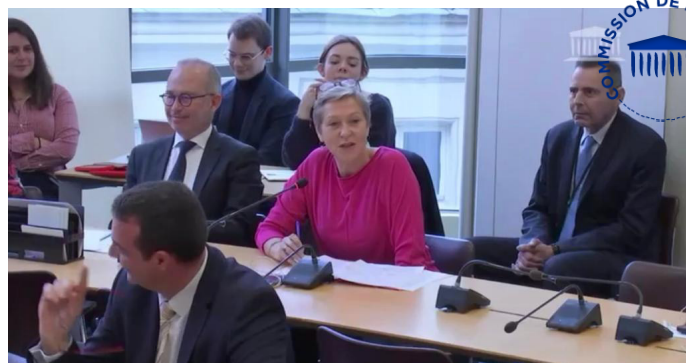
Présentation du rapport sur le bilan de la loi de programmation militaire 2019-2025

Nous avons également pu faire part de nos remontées de terrain. L'occasion de l'interroger sur la problématique de l'accès au logement en zone littorale du fait de l'attractivité de nos territoires, sujet que les communes, intercommunalités et acteurs de l'habitat ont à traiter quotidiennement.