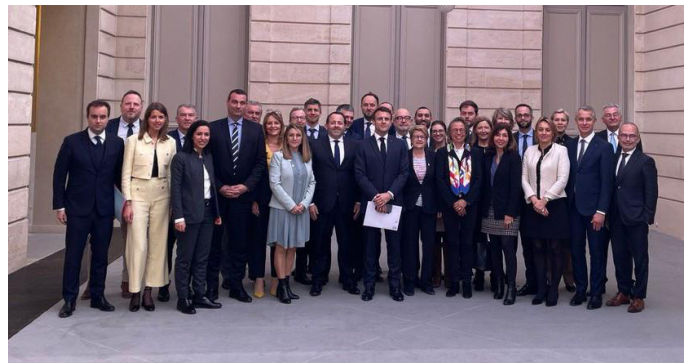
Echanges entre les membres de la majorité de la commission de la Défense et le Président de la République

Soirée de clôture des travaux menés par les 6 groupes de travail de la loi de programmation militaire 2024-2030, en présence du ministre des Armées, Sébastien Lecornu. Pendant plusieurs semaines, ces groupes composés de militaires, chercheurs, industriels, associations et parlementaires de tous les groupes politiques ont tenu des réunions afin d'aboutir à des recommandations en vue de ce texte. Pour ma part, je me suis investie au sein du groupe de travail « Cyber et Espace ».