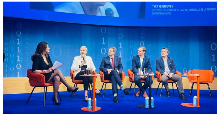
Intervention à la REFnumérique organisée par le MEDEF France

L'occasion pour moi de rappeler l'ambition forte que la France porte en matière de cybersécurité pour les Jeux Olympiques et paralympiques 2024 et l'ensemble des événements qui se dérouleront sur son territoire.