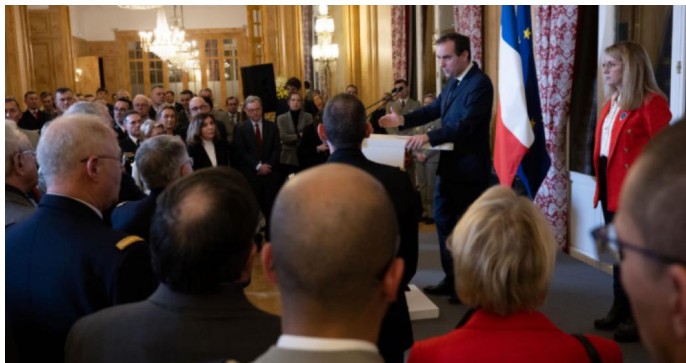
Soirée de clôture des groupes de travail sur la future loi de programmation militaire 2024-2030

Soirée de clôture des travaux menés par les 6 groupes de travail de la loi de programmation militaire 2024-2030, en présence du ministre des Armées, Sébastien Lecornu. Pendant plusieurs semaines, ces groupes composés de militaires, chercheurs, industriels, associations et parlementaires de tous les groupes politiques ont tenu des réunions afin d'aboutir à des recommandations en vue de ce texte. Pour ma part, je me suis investie au sein du groupe de travail « Cyber et Espace ».