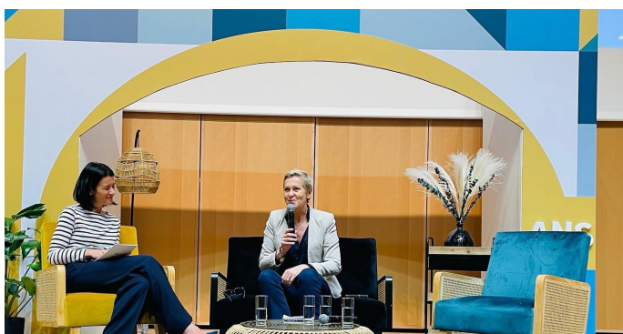
10 ans de l'IRT System X à l'ENS Paris-Saclay

Lors de la table-ronde «Cybersécurité: les atouts de la France», je suis notamment revenue sur la nécessité de renforcer la prévention et la sensibilisation aux risques cyber, l'accompagnement des organisations, l'organisation de la filière industrielle ainsi que sur les évolutions réglementaires et législatives dans ce domaine.